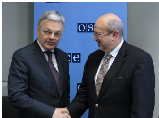
Didier Reynders - Lamberto Zanier (Secrétaire général de l'OSCE / Secretaris-generaal van de OVSE)

Didier Reynders, Minister van Buitenlandse zaken, was in Wenen op 12 maart om de Belgische prioriteiten als voorzitter van de Raad van Europa voor te stellen aan de leden van de Permanente Raad van de Organisatie voor Veiligheid en Samenwerking in Europa (OVSE). Voor de buitenwereld is Secretaris-generaal Thorbjørn Jagland het meest gekende gezicht van de Raad van Europa. Als president van het Comité van Ministers, is de Belgische Minister van Buitenlandse zaken de eerste van zijn gelijken en dirigeert hij het interne politieke overleg tussen de 47 lidstaten (13 november 2014-19 mei 2015). Hij draagt ook bij tot het politiek overleg met andere spelers als de Europese Unie, de OVSE of de Verenigde Naties. Lees hier zijn toespraak van 12 maart over de prioriteiten van het BE Voorzitterschap van de Raad van Europa.