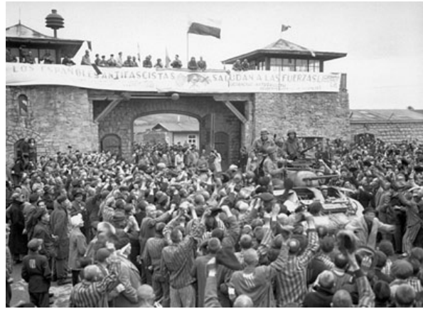
Le camp de Mauthausen libéré / De bevrijding van het kamp Mauthausen.