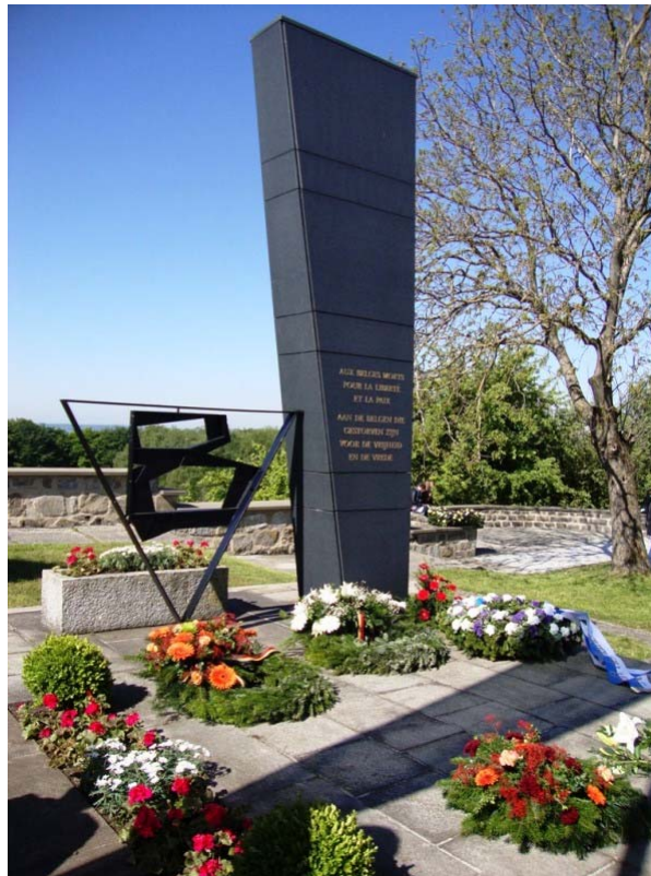
Monument belge / Belgisch Monument

Plus d'informations / Meer informatie : Mauthausen-Memorial