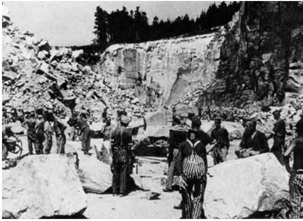
Détenus dans la carrière « Wiener Graben » / Gevangenen in de steengroeve « Wiener Graben ».