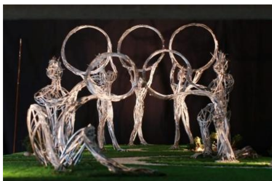
L'Allée des Athlètes, d'Olivier Strebelle, orne le parc olympique de Pékin / "De Athletes' alley" van Olivier Strebelle, siert het olympische park te Beijing