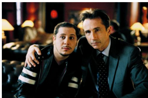
Comme tout le monde (11-4-2008, 19:00)