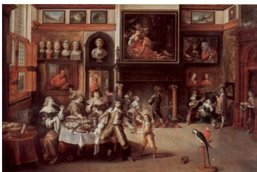
Gastmahl im Hause des Bürgermeisters Rockox (Frans II. Francken)