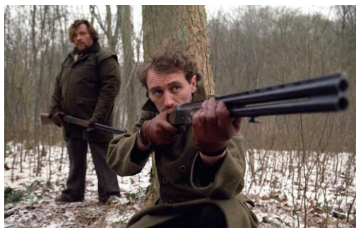
Bunker paradise (13-4-2008, 21:00)