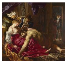
Samson und Dalilah (Pierre-Paul Rubens)