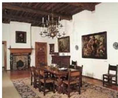
Maison Rockox, Antwerpen

burgemeester Nicolaas Rockox, het werk Samsom en Dalilah. Van 1700 tot 1880, datum van zijn verkoop, bevond zich het schilderwerk in de Rubensverzameling van de Prins van Liechtenstein. De huidige tentoonstelling bevat behalve dit meesterwerk van Rubens nog andere werken uit de collectie Rockox, o.a. een werk van Frans II Francken ( Gastmahl im Hause des Bürgermeisters Rockox , gedateerd ongeveer 1630), dat de woonkamer van Nicolaas Rockox, waar het schilderij "Samson en Dalilah" hing, weergeeft. Deze tentoonstelling was voordien te zien in het Rockox Huis. Meer informatie.