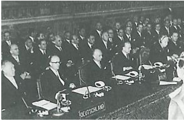
A gauche: Le 25 mars 1957, les six pays fondateurs signent le Traité de Rome. Links: Op 25 maart 1957 ondertekenen de 6 oprichtingslanden het Verdrag van Rome.

Op 25 maart 1957 ondertekenden zes landen te Rome de basisverdragen van de Europese Economische Gemeenschap (EEG), voorloper van de Europese Unie. Deze landen waren Duitsland, België, Frankrijk, het Groothertogdom Luxemburg, Italië en Nederland. Om deze verjaardag te vieren zullen er diverse manifestaties overal in de Unie georganiseerd worden. Op de vooravond van de officiële plechtigheden in Rome en Berlijn zal Brussel op 24 maart de