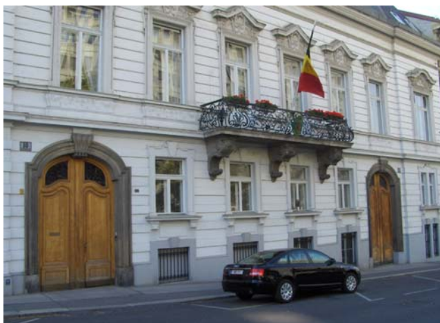
Façade avant de la Résidence / Voorgevel van de de Residentie

Het gebouw van de residentie van de Ambassadeur van België in de Schönburgstraße werd in 1880 gebouwd door Viktor Rumpelmayer (1830-1885), beroemde architect van zijn tijd, die in zijn bouwstijl Italiaanse en Franse elementen met typische Weense kenmerken verbond. De uit Bratislava afkomstige Rumpelmayer bouwde talrijke paleizen en ambassades in Wenen, waaronder die van Groot-Brittannië (1875) (evenals de Anglicaanse kerk) en die van Duitsland * (1877). In het buitenland bouwde hij het Koninklijk Paleis te Sofia (de huidige National Art Gallery). Nummer 8-10 van de Schönburgstraße was vroeger het paleis van Prinses Rosa Hohenlohe-Bartenstein. In 1922 betrok de Belgische Afvaardiging het gebouw met de residentie van de Minister op nr. 10 en de kantoren op nr. 8. Nu wordt het slechts gebruikt als Residentie van de Ambassadeur van België. De kantoren (kanselarij) bevinden zich in de Wohllebengasse 6, 1040 Wenen. Door de aankoop op 17 november 1934 werd België er eigenaar van. Het gebouw met elementen van de Oostenrijkse barokstijl heeft drie verdiepingen. De ontvangstruimten nemen het grootste deel van de eerste verdieping in beslag. (* ) Werd in de II Wereldoorlog vernietigd en in 1957 gesloopt om er vervolgens een nieuw gebouw te bouwen.