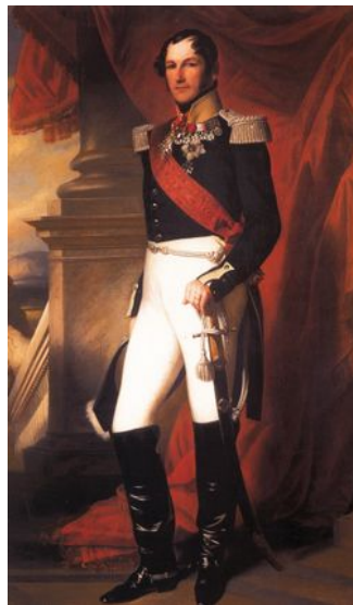
Léopold 1er / Leopold 1

In Oostenrijk heeft 15 november eveneens een speciale betekenis: Leopold III, zesde Markgraaf van Oostenrijk , genaamd De Vrome, van het geslacht Babenberg is de beschermheilige van Oostenrijk sinds 1663 (vervanger van Koloman) en meer bepaald van het Bundesland Niederösterreich. In Wenen en Oberösterreich deelt hij deze functie met respectievelijk de Heilige Klemens Maria Hofbauer en de Heilige Florian. Onder zijn bewind heersten vroomheid en vrede, wat van hem een gewaardeerde vorst maakte. In 1113 verplaatste hij zijn residentie van Melk naar Klosterneuburg in Niederösterreich, dat zich ontwikkelde nadat hij er een klooster liet bouwen. De werken begonnen in 1114. Leopold III stierf op 15 november 1136. Talrijke bedevaarders bezochten zijn laatste rustplaats, het klooster van Klosterneuburg, om hem te danken voor zijn wonderen. Leopold werd in 1485 door Paus Innocentius VIII heilig verklaard. 15 november is een schoolvrije dag in Wenen en een feestdag in Niederösterreich. De Heilige Leopold staat afgebeeld op de wapenschilden van het tweede en van het vierde district van Wenen.