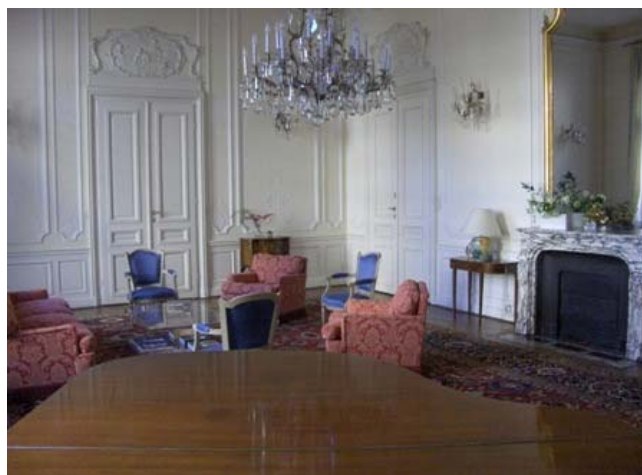
Grand salon de réception / Groot receptiesalon

Le bâtiment de la Résidence de l'Ambassadeur de Belgique, Schönburgstraße, a été construit en 1880 par Viktor Rumpelmayer (1830 - 1885), architecte fameux de l'époque, dont le style alliait des éléments italiens et français ainsi que les traits viennois caractéristiques. Originaire de Bratislava, Rumpelmayer construisit de très nombreux palais et ambassades à Vienne, dont celle de Grande-Bretagne (1875) (ainsi que l'église anglicane) et celle de d'Allemagne * (1877). A l'étranger, on lui doit notamment le Palais royal de Sofia (aujourd'hui National Art Gallery) en Bulgarie. Le 8-10 Schönburgstraße était à l'origine le palais de la Princesse Rosa Hohenlohe-Bartenstein. En 1922, s'y établit la Légation de Belgique, résidence du Ministre (n° 10) et bureaux (n° 8). Elle n'est plus utilisée aujourd'hui que comme Résidence de l'Ambassadeur de Belgique, les bureaux (Chancellerie) de l'Ambassade étant établis Wohllebengasse 6, à 1040 Vienne. Acquis le 17 novembre 1934, l'immeuble est propriété de la Belgique. Le bâtiment, inspiré du baroque autrichien, s'élève sur trois niveaux. Les pièces de réception occupent la plus grande partie du premier étage. (* ) Détruite durant la 2 e guerre mondiale, l'ambassade d'Allemagne fut rasée en 1957 avant qu'un nouveau bâtiment ne soit construit.